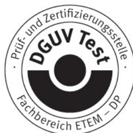
Unterschrift (Dipl.-Ing. Vogl)

Weiteres über die Gültigkeit, eine Gültigkeitsverlängerung und andere Bedingungen regelt die Prüf- und Zertifizierungsordnung vom August 2012.